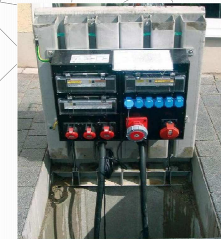
PRÍKLAD UMÍSTĚNÍ ROZVODNÉJ ELEKTRICKEJ SKRINE POD CHODNÍK