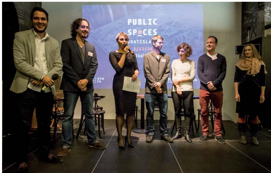
Hlavní organizátori medzinárodnej konferencie sa spoločne predstavili v jej závere

Konferencia naopak venovala súťažiam mimoriadnu pozornosť. Ukázalo sa napríklad, že u našich západných susedov