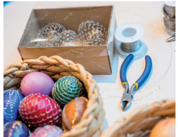
Ilustrácia 03 - 01 - 2015

veľkonočných zvykov na Slovensku, ale aj hudobno-tanečné vystúpenia folklórneho súboru Studienka, ktoré sa uskutočnia v Rotunde Polusu v sobotné popoludnia 12. a 19. marca. Viac informácií sa dozviete na www.polus.sk