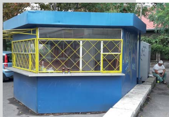
Opustený stánok je už z Brezovskej ulice odstránený

Uspokojivo pre občanov sa vyriešilo aj odstránenie novinového stánku na rohu Račianskej a Vajnorskej ulice, ktorý stál na pozemku magistrátu. „ Mestská časť vyvíja úsilie, aby majitelia stánky využívali, udržiavali čisté a po skončení prevádzky stavby odstránili. Ak treba, kontaktujeme aj súkromných vlastníkov pozemkov. Niekedy sa podarí dosiahnuť, že majiteľ nájde pokračovateľa činnosti a stánok naďalej prináša