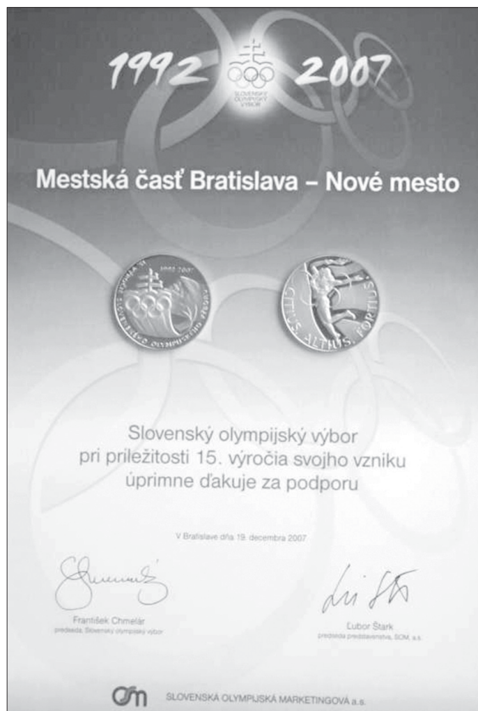
Zlatá medaila – ocenenie, ktoré mestskej časti Bratislava-Nové Mesto udelil Slovenský olympijský výbor ako ocenenie za morálnu podporu olympijského hnutia na Slovensku