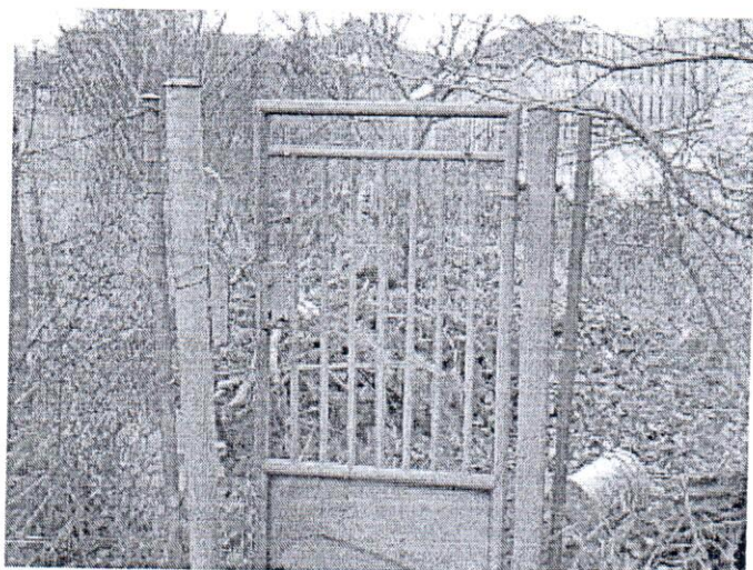
Vstupná bránička na pozemok