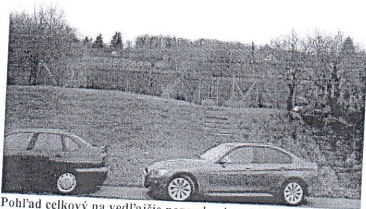
Pohľad celkový na vedľajšie pozemky, ktoré mali byť súčasťou plánovanej výstavby