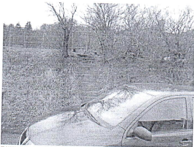
Bližší čelný pohľad