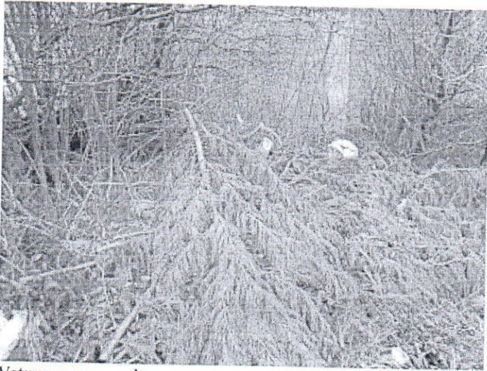
Vstup na pozemok