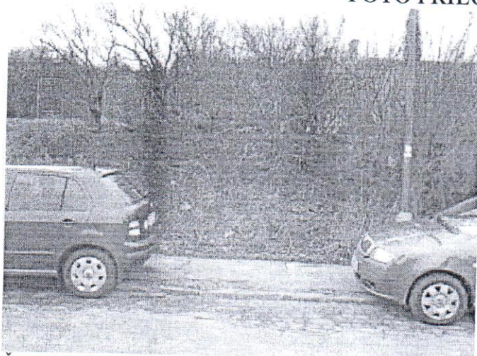
Čelný pohľad na predmetný pozemok, Klenová ul. parc.č. 19351/2 – záhrada v k.ú. Vinohrady