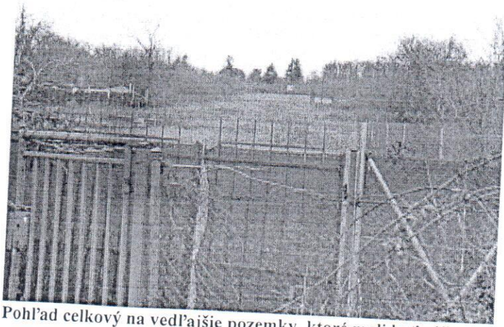
Pohľad celkový na vedľajšie pozemky, ktoré mali byť súčasťou plánovanej výstavby