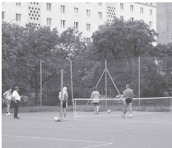
Aj takto, aktívnym pohybom, sa oslavovalo 13. výročie založenia Školak klubu